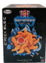
SADIA BANDIDOS SWEET CHILI 2 KG