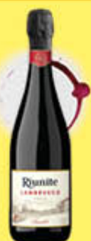
RIUNITE VINO LAMBRUSCO AMABILE IGT 75 CL