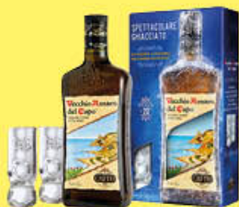
VECCHIO AMARO DEL CAPO 70 CL + 2 BICCHIERI