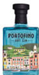
GIN PORTOFINO 50 CL