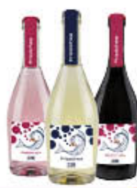
FRIZZICHEA VINO IGT FRIZZANTE BARBERA/ROSATO/ FALANGHINA 75 CL