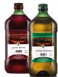
VITIVINICOLA SAN MICHELE VINO ROSSO/BIANCO 2 LITRI