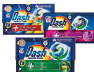
DASH PODS POWER X 19