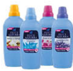
FELCE AZZURRA AMMORBIDENTE TUTTI I TIPI 2 LITRI