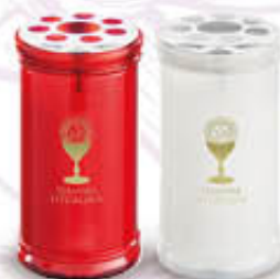
LUMICART CERO T40