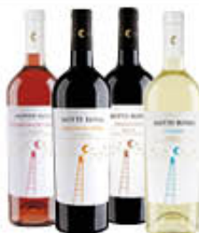
NOTTEROSSA VINI DEL SALENTO IGP 75 CL