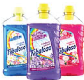
FABULOSO PAVIMENTI TUTTI I TIPI 1,25 LITRI