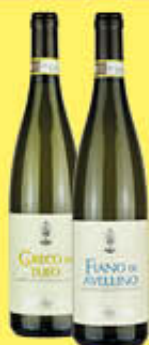
MASTROBERARDINO FIANO E GRECO DOCG 75 CL