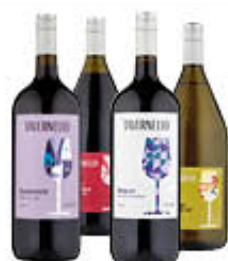
TAVERNELLO VINO VETRO TUTTI I TIPI 1,5 LITRI