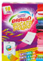
BRAUN BUCATO SICURO 10 FOGLI