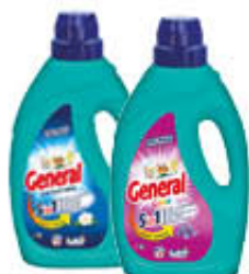
GENERAL CLASSICO/COLOR 28 LAVAGGI