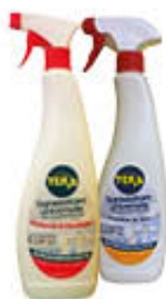
TERS SGRASSATORE CLASSICO/MARSIGLIA 750 ML