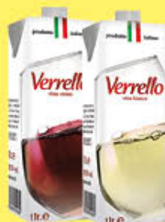
VERRELLO VINO BRIK 1 LITRO