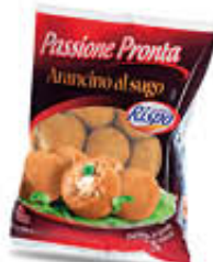
RISPO ARANCINI MEDI 500 GR