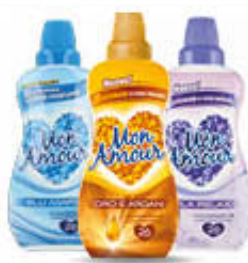
MON AMOUR CONCENTRATO TUTTI I TIPI 26LAV 650ML