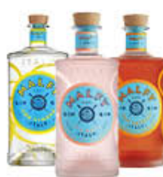
MALFY GIN LIMONE/ROSA/ARANCIA 70 CL