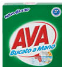
AVA BUCATO A MANO E2 380 GR