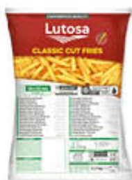
LUTOSA PATATE STRAIGHT CUT 10/10 2,5 KG