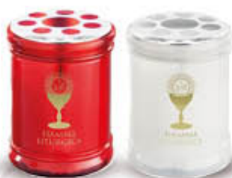
LUMICART CERO T20