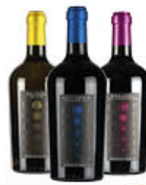
BORGOFULVIA VINO IMPERO GUTTUNNIO/ MALVASIA/BONARDA 75 CL