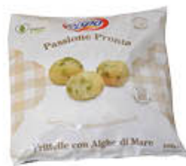
RISPO FRITELLE ALGHE 500 GR