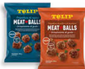
TULIP MEATBALLS SUINO E POLLO/ TACCHINO 340 GR