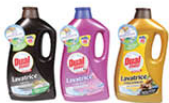
DUAL LAVATRICE 40 LAVAGGI