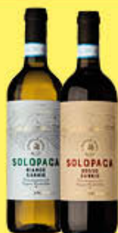
CANTINA DI SOLOPACA VINO SOLOPACA DOC BIANCO/ROSSO 75 CL