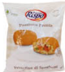
RISPO FRITTATINA SPAGHETTI 500 GR