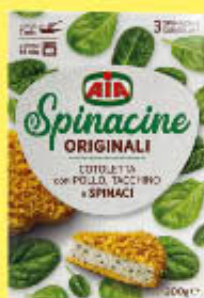
AIA SPINACINE 300 GR