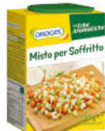
OROGEL MISTO PER SOFFRITTO 150 GR