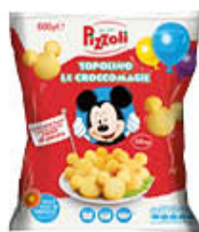
PIZZOLI CROCCOMAGIE TOPOLINO 600 GR