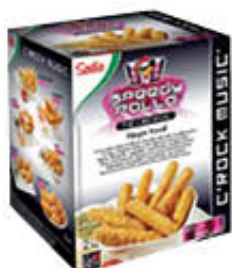
SADIA SPEEDY POLLO ORIGINAL 2 KG