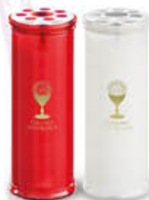
LUMICART CERO T100