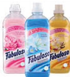
FABULOSO AMMORBIDENTE CONCENTRATO VARIE PROFUMAZIONI 56 LAVAGGI