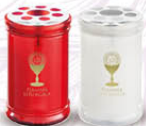
LUMICART CERO T30