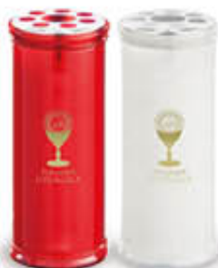
LUMICART CERO T80