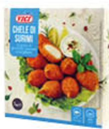
VICI CHELE DI GRANCHIO PANATE 1 KG