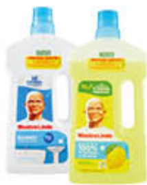
MASTROLINDO TUTTI I TIPI 950 ML