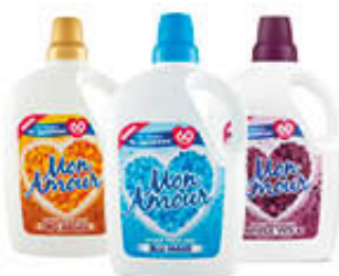
MONAMOUR AMMORBIDENTE BLU MARE/ARGAN/ VIOLA 60 LAVAGGI