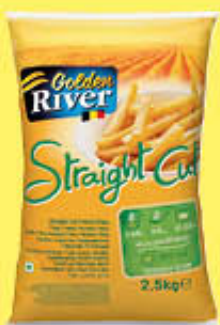
GOLDEN RIVER PATATE STRAIGHT CUT 2,5 KG