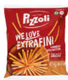
PIZZOLI PATATE WE LOVE EXTRA FINI 750 GR