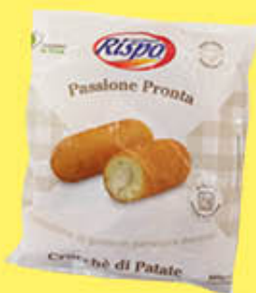
RISPO CROCCHÉ PROSCIUTTO E MOZZARELLA 500 GR