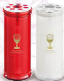
LUMICART CERO T50