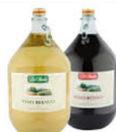
BARONE DAMA VETRO VINO DA TAVOLA BIANCO/ROSSO 5 LITRI