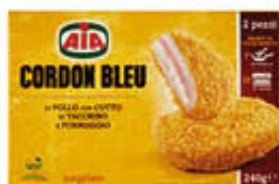
AIA CORDON BLEU 240 GR