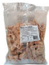
AIA KEBAB POLLO COTTO IQF 1 KG