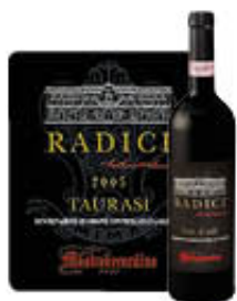
MASTROBERARDINO VINO TAURASI RADICI DOCG 2018 - 75 CL