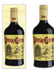
STREGA CREAM CON ASTUCCIO 70 CL