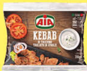
AIA KEBAB 300 GR