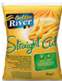
GOLDEN RIVER PATATE 1 KG