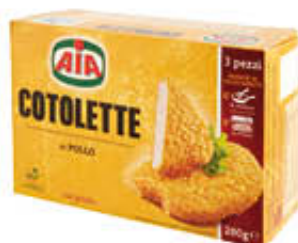
AIA COTOLETTE 280 GR