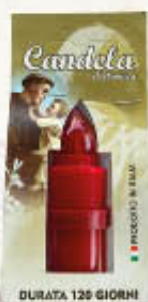
LUMICART CANDELA ELETTRICA ROSSA 60 GIORNI