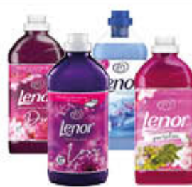
LENOR CONCENTRATO TUTTI I TIPI 42/37 LAVAGGI