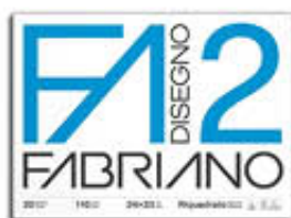
FABRIANO BLOCCO F2 FG20 24X33 L. RIQUADRATO