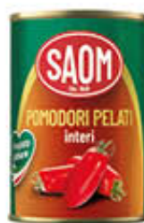
SAOM POMODORI PELATI 400 GR