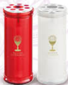
LUMICART CERO T50