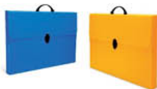
VALIGETTA POLIONDA COLORATA 27X38X5