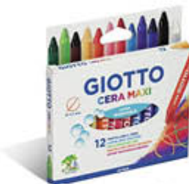
GIOTTO PASTELLI A CERA X 12