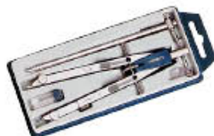
ALESSI COMPASSO BALAUSTRONE