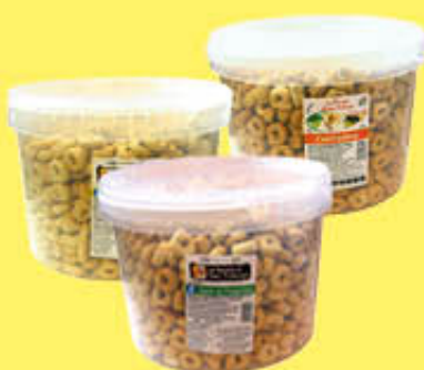
SAN TRIFONE TARALLI VARI GUSTI SECCHIELLO 3 KG