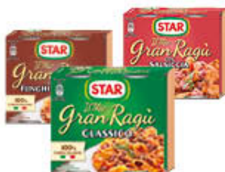
STAR GRANRAGÙ TUTTI I TIPI 180 GR X 2