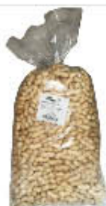
STUZZICANTE ARACHIDI TOSTATI 5 KG