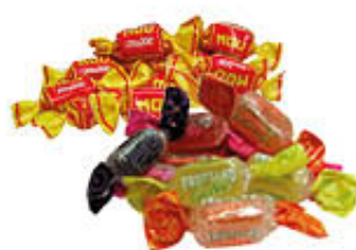
LA GIULIA CARAMELLE MOU/GELEES 1 KG