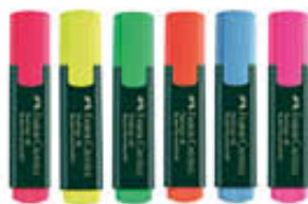
FABER CASTELL EVIDENZIATORI TEXTLINE