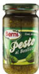
BERNI PESTO ALLA GENOVESE 135 GR