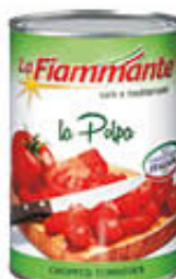
LA FIAMMANTE LA POLPA DI POMODORO 400 GR