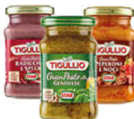
STAR PESTO TIGULLIO 190 GR