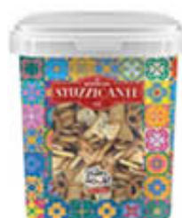
LA STUZZICANTE SALATINI MIX 1 KG