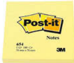
POST-IT NOTES 125F 76X76 3M