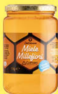
COMARO MIELE MILLEFIORI VV 1 KG