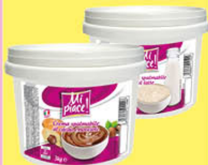
MI PIACE CREMA SPALMABILE 3 KG