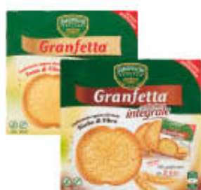
SAN SEPOLCRO BIFETTE DORATE/INTEGRALI 16 X 2