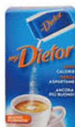
DIATOR BAR 210 BUSTINE