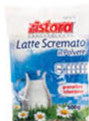
RISTORA LATTE SCREMATO IN POLVERE GRANULARE 500 GR