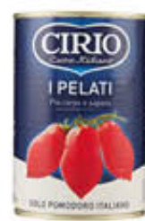
CIRIO I PELATI T1/2 400 GR