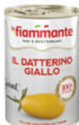
LA FIAMMANTE DATTERINI GIALLI LATTINA 400 GR