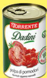
LA TORRENTE POLPA DADINI 400 GR