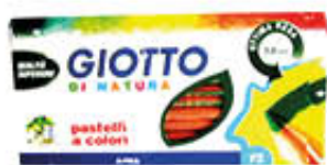
GIOTTO PASTELLI NATURA 12 PEZZI