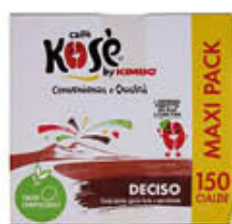
KOSÈ CAFFÈ DECISO 150 CIALDE