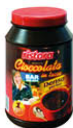
RISTORA CIOCCOLATA DENSA 1 KG