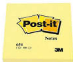
POST-IT NOTES 100F 75X75