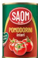
SAOM POMODORINI 400 GR