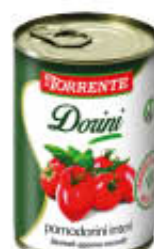
LA TORRENTE POMODORINI DORINI 400 GR