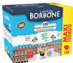
CAFFÈ BORBONE MISCELA DECISA 120 CIALDE