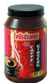
RISTORA CAFFÈ & GINSENG 1 KG