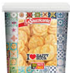
LA STUZZICANTE SNACK MESSICANO 1 KG