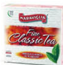
RISTORA TE MARAVIGLIA 100 FILTRI