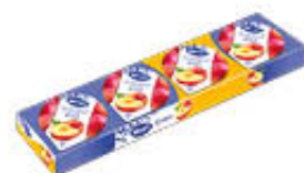
HERO CONFITTURE MONO 25 GR. X 4 ESCLUSO MIELE/FRUTTI DI BOSCO/MIRTILLO