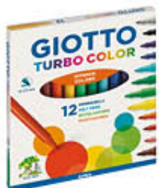
GIOTTO PENNARELLI TURBO COLOR 12 PEZZI