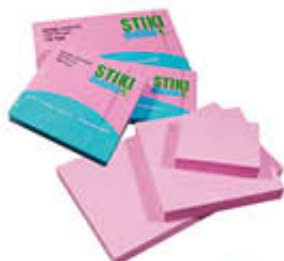
SPIL STIKI MEMO ROSA 40x50 100F