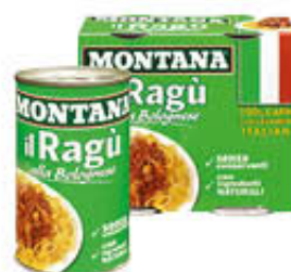
MONTANA RAGÙ BOLOGNESE 180 GR X 2