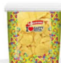
LA STUZZICANTE NACHOS CHIPS 800 GR