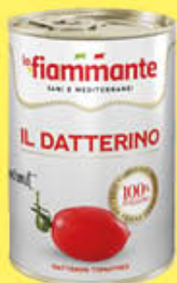
LA FIAMMANTE IL DATTERINO ROSSO 400 GR