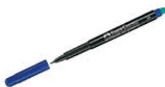
FABER CASTELL MARCATORE PERMANENTE