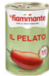
LA FIAMMANTE POMODORI PELATI T1/2 400 GR