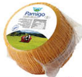
BAYERNLAND PAMIGO BABY SV AL KG