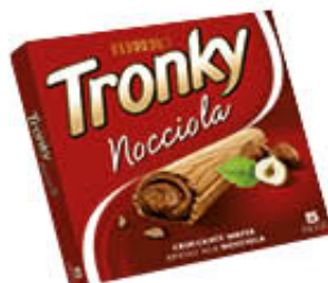
TRONKY CLASSICO 5 PEZZI