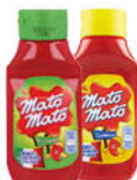
KRAFT MATO MATO SQUEEZE DOLCE/PICCANTE 390 GR