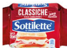
SOTTILETTE 200 GR