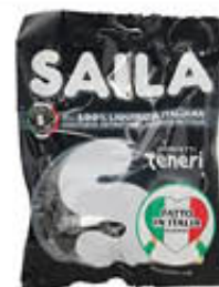
SAILA CARAMELLE BUSTA 100 GR