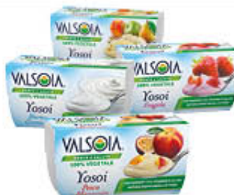
VALSOIA YOGURT YOSOI 125 GR X 2