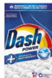
DASH POWER FUSTONE 86 MISURINI