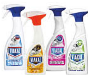
VIAKAL SPRAY TUTTI I TIPI 470/500 ML