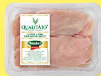
AMADORI PETTO POLLO FETTE 400 GR