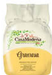
CASA MODENA PROSCIUTTO COTTO GRANROSA AL KG