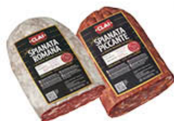
CLAI SPIANATA ROMANA/PICCANTE 1/2 SV AL KG