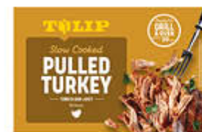
TULIP PULLED TURKEY 500 GR