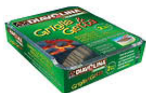
DIAVOLINA GRIGLIA E GETTA