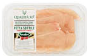
AMADORI PETTO POLLO FETTE SOTTILI 250 GR