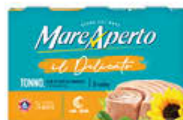
MAREAPERTO TONNO DELICATO DI GIRASOLE 70 GR X 6