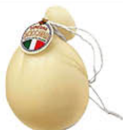
LATTERIA SORESINA CACIOCVALLO AL KG