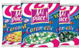
MI PIACE CARAMELLE SACCHETTI TUTTI I GUSTI 180/200 GR