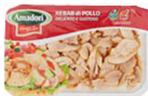
AMADORI KEBAB POLLO FETTE 280 GR