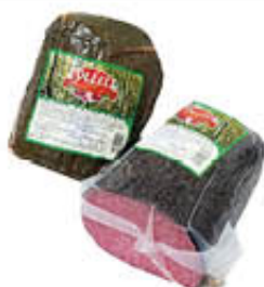
COLLEL SALAME PEPE/ERBE TUNNEL AL KG