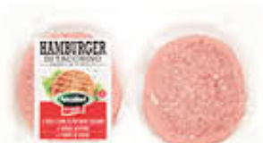
AMADORI HAMBURGER TACCHINO 80 GR X 2 STD