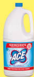
ACE CANDEGGINA 4 LITRI