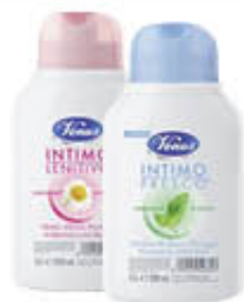
VENUS IGIENE INTIMA 200 ML