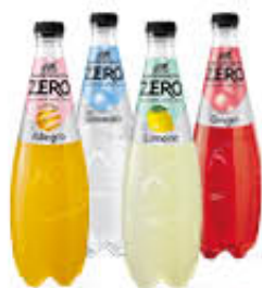
SAN BENEDETTO BIBITE ZERO 75 CL