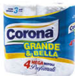
CORONA CARTA IGIENICA GRANDE&BELLA 3 VELI 4 ROTOLI