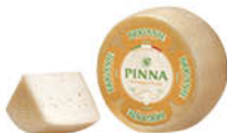
PINNA FORMAGGIO BRIGANTE SARDO AL KG