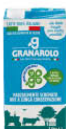
GRANAROLO LATTE PS 1 LITRO