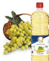
QUALITA' PIU' ACETO BIANCO PET 1 LITRO