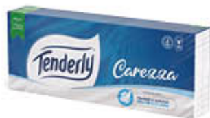
TENDERLY 10 PZ