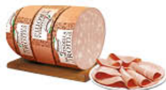
FIORUCCI MORTADELLA AROMA CON PISTACCHI AL KG