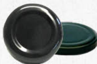
CAPSULE PER BOTTIGLIE DIAMETRO 38/43