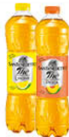
SAN BENEDETTO THE CLASSICO 1,5 LITRI