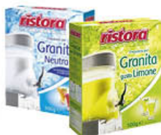
RISTORA PREPARATO PER GRANITE 500 GR