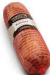
VALTIDONE PANCETTA ARROTOLATA ROSATELLA 1/2 SV AL KG