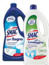
SMAC GEL BAGNO/ CON CANDEGGINA 850 ML