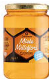
COMARO MIELE MILLEFIORI VV 1 KG