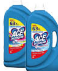
ACE LIQUIDO LAVATRICE PROFESSIONAL CLASSICO/COLOR 63 L