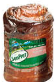
SENFTER PORCHETTA TRANCIO SV AL KG