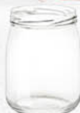
VASO VETRO DB2 580 ML