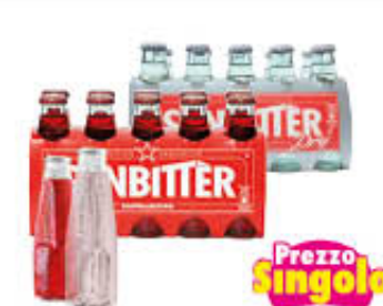
SAN PELLEGRINO BITTER DRY/ROSSO 10 CL