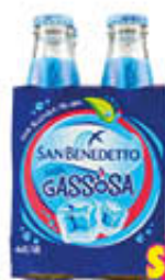
SAN BENEDETTO GASSOSA VETRO 18 CL