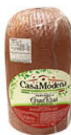
CASA MODENA MORTADELLA GRAN ROSA 1/2 AL KG