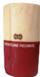
PLAC PROVOLONE TRANCIO T3 SOTTOVUOTO AL KG