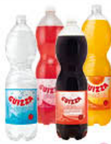
GUIZZA BEVANDE TUTTI I TIPI 1,5 LITRI