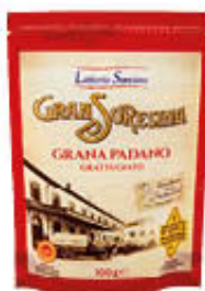
SORESINA GRANA PADANO GRATTUGIATO 100 GR