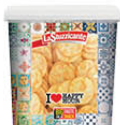
LA STUZZICANTE SNACK MESSICANO 1 KG