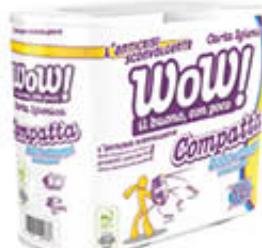
WOW CARTA IGIENICA 4 MAXI ROTOLI 2 VELI 2000 STRAPPI