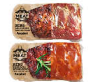
AMADORI RIBS SUINO SV SALE & PEPE/ PAPRIKA & ROSMARINO 600 GR