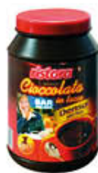
RISTORA CIOCCOLATA DENSA 1 KG