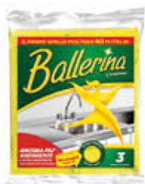
PANNO BALLERINA ORIGINALE 3 PZ