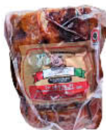
LONGOBARDI PORCHETTA T4 SV AL KG