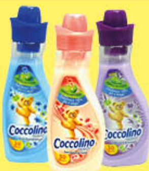
COCCOLINO CONCENTRATO 28 LAVAGGI TUTTI I TIPI