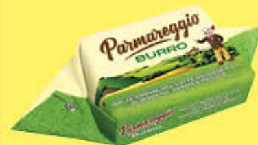
PARMAREGGIO BURRO 200 GR