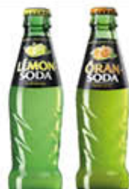
LEMONSODA/ ORANSODA 20 CL