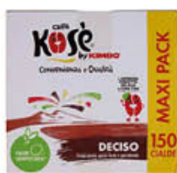
KOSE CAFFÈ DECISO 150 CIALDE