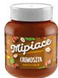
MI PIACE CREMA SPALMABILE NOCCIOLA 400 GR