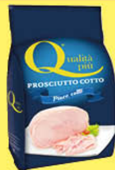
QUALITA' PIÙ PROSCIUTTO COTTO PIACE COTTO AL KG