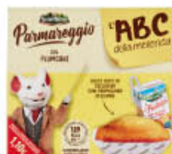
GRANTERRE L'ABC DELLA MERENDA CON PLUMCAKE