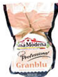
CASA MODENA PROSCIUTTO COTTO GRANBLU' AL KG