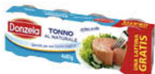
DONZELA TONNO AL NATURALE 80 GR X 3 + 1