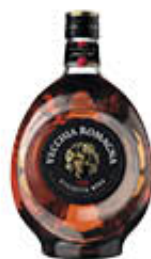
VECCHIA ROMAGNA ETICHETTA NERA 70 CL