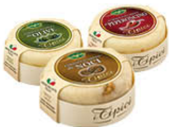
TREVALLI FORMAGGIO MISTO OLIVE/NOCI/ PEPERONCINO 180 GR