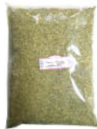
VINCENZINO BARRA ORIGANO BUSTA 1 KG