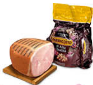
PARMACOTTO PROSCIUTTO COTTO ORIGINALE AL KG