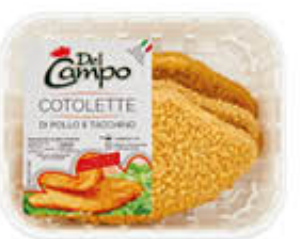
DEL CAMPO COTOLETTA POLLO/TACCHINO 220 GR