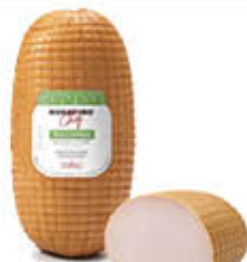
ROSAFINO PETTO DI TACCHINO AL FORNO 1/2 SV AL KG