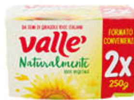
VALLE MARGARINA CLASSICA 250 GR X 2