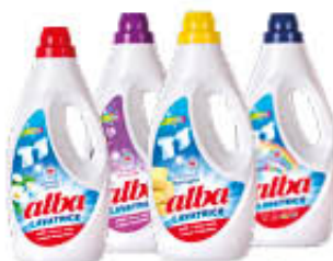
ALBA LIQUIDO LAVATRICE TUTTI I TIPI 28 LAVAGGI