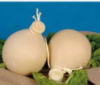
PLAC FIASCETTE T2 AL KG