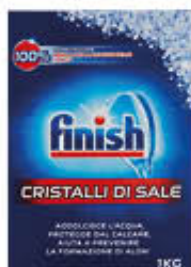
FINISH SALE PURISSIMO PER LAVASTOVIGLIE 1 KG