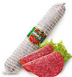
CLAI SALAME MILANO EXTRA 1/2 SV AL KG