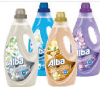
ALBA AMMORBIDENTE 33 LAVAGGI