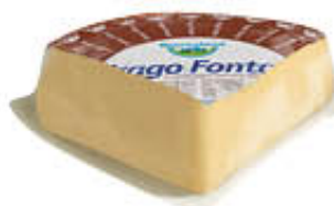
BAYERNLAND FORMAGGIO FRAGO 1/4 SV AL KG