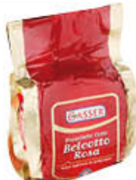
GASSER PROSCIUTTO COTTO BELCOTTO ROSA AL KG