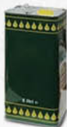
LATTA PER OLIO C/TAPPO 5 LITRI