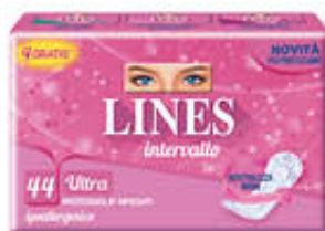
LINES INTERVALLO RIPIEGATO X 40 + 4