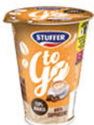
STUFFER TO GO 230 ML