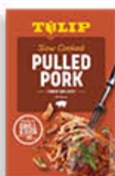
TULIP PULLED PORK 550 GR