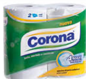
CORONA CARTA IGIENICA 4 MAXI ROTOLI 2 VELI