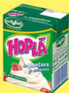
HOPLÀ DA MONTARE ZUCCHERATA 200 ML