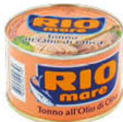
RIO MARE TONNO IN OLIO DI OLIVA LATTINA STRAPPO 240 GR