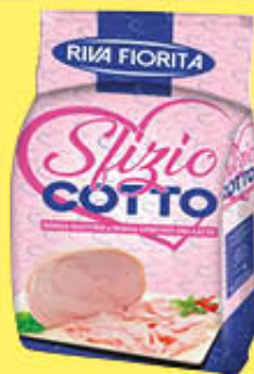
RIVAFIORITA SFIZIO COTTO AL KG