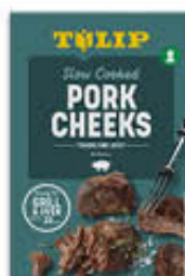
TULIP PORK CHEEKS 400 GR