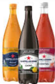
SAN PELLEGRINO BIBITE PET 1,20 LT