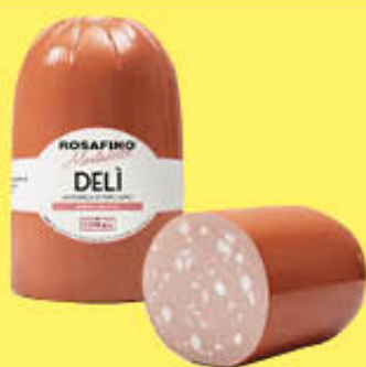
COMAL MORTADELLA DELI CON PISTACCHIO T15 C240 AL KG