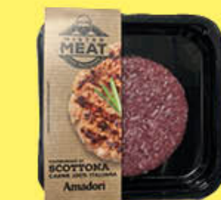
AMADORI HAMBURGER DI SCOTTONA SKIN 180 GR