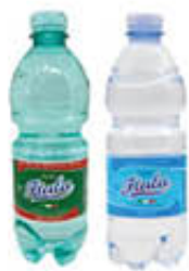
ACQUA ITALA NATURALE/ EFFERVESCENTE 50 CL