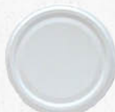
TAPPO A VITE PER BARATTOLO DIAMETRO 82