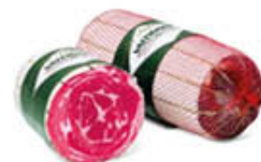
VALTIDONE PANCETTA COPPATA 1/2 SV AL KG