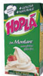
HOPLÀ DA MONTARE ZUCCHERATA 500 ML