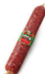
CLAI SALAME NAPOLI T1,5 AL KG