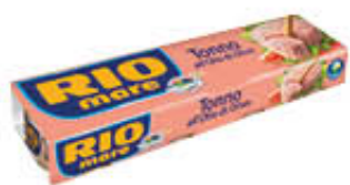
RIO MARE TONNO ALL'OLIO DI OLIVA 80 GR X 4