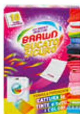
BRAWN BUCATO SICURO 10 FOGLI