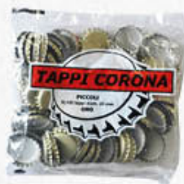
TAPPI CORONA PER BOLLITURA 100 PEZZI