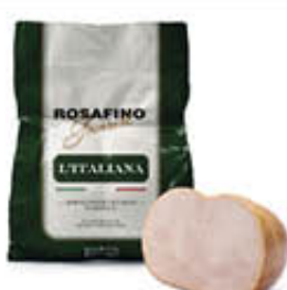
COMAL DOPPIAFESA TACCHINO NAZIONALE AL KG