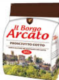
BORGO ARCATO PROSCIUTTO COTTO AL KG