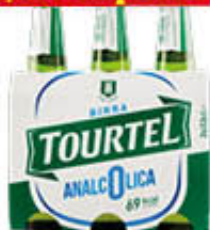
TOURTEL BIRRA VETRO 33 CL X 3