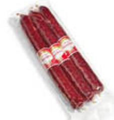
CLAI DIAVOLETTA SV X3 AL KILO