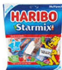
HARIBO STARMIX MPK 280 GR