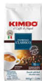
KIMBO CAFFÈ ESPRESSO IN GRANI 1 KG