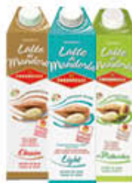
CONDORELLI LATTE DI MANDORLA CLASSICO/LIGHT/ PISTACCHIO 1 LITRO