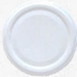
TAPPO A VITE PER BARATTOLO DIAMETRO 70