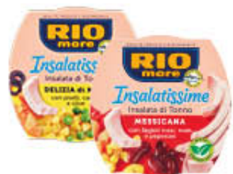
RIO MARE INSALATISSIME CLASSICHE/AL RISO VARI GUSTI 160 GR