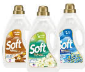
SOFT AMMORBIDENTE TUTTI I TIPI 50 LAVAGGI