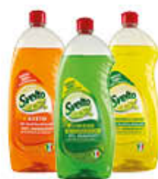
SVELTO LIMONE VERDE/ ACETO / ZENZERO/LIMONE 930 ML