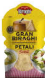
GRANBIRAGHI PETALI SOTTILI 80 GR