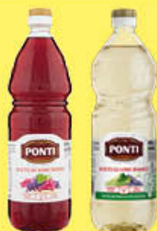
PONTI VINO BIANCO/ROSSO PET 1 LITRO