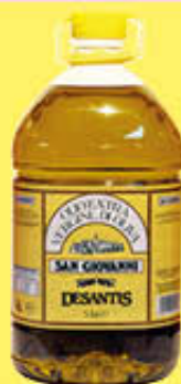
DESANTIS OLIO EXTRAVEVERGINE SAN GIOVANNI 5 LITRI