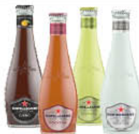
SAN PELLEGRINO BIBITE VETRO TUTTI I TIPI 20 CL