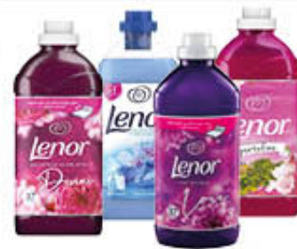
LENOR CONCENTRATO TUTTI I TIPI 42/37 LAVAGGI