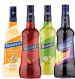
KEGLEVICH VODKA ALLA FRUTTA ESCLUSO LIMONE E PANNA E FRAGOLA 70 CL