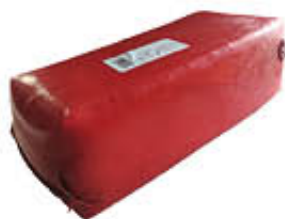
ADAMINO FORMAGGIO KG 2,5