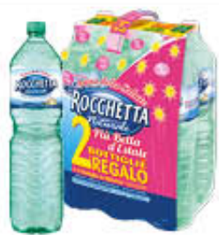
ROCCHETTA ACQUA NATURALE 1,5 LITRI