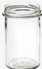
VASO VETRO 314 ML