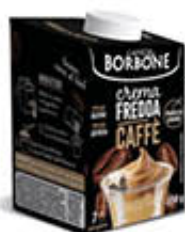
BORBONE CREMA CAFFÈ FREDDA 550 GR