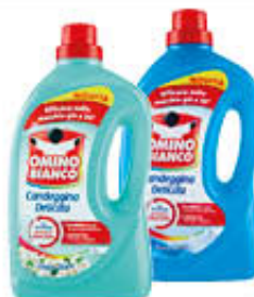
OMINO BIANCO CANDEGGINA DELICATA 2 LITRI