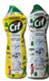
CIF CREMA TUTTI I TIPI 750 ML