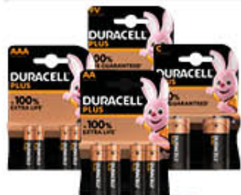
DURACELL PLUS STILO E MINI X4 TORCIA E MEZZA X2 9V X1