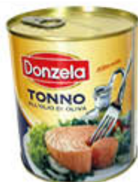
DONZELA TONNO ALL'OLIO DI OLIVA 800 GR