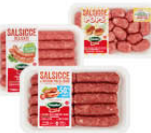
AMADORI SALSICCIA - 50%GRASSI/ DELICATA/POPS 360/400 GR