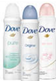
DOVE DEODORANTE SPRAY TUTTI I TIPI 150 ML