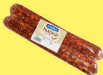
BECELLI SALSICCIA NAPOLI BACCHETTA PICCANTE SV - AL KG