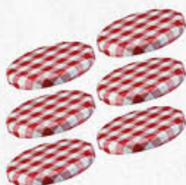
TAPPO A VITE PER BARATTOLO DIAMETRO 63