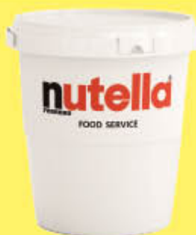
NUTELLA 3 KG