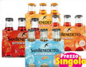
SAN BENEDETTO BITTER BIANCO/ ROSSO GINGER CLASSICO/BIONDO 10 CL