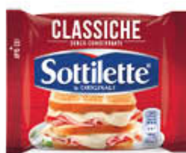
SOTTILETTE 400 GR