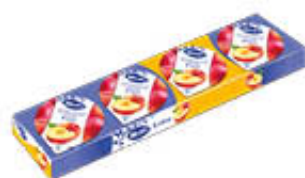
HERO CONFETTURE MONO 25 GR X 4 ESCLUSO MIELE/FRUTTI DI BOSCO/MIRTILLO