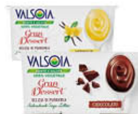
VALSOIA GRAN DESSERT DELIZIA ALLA MANDORLA CIOCC/VAN 115 GR X 2