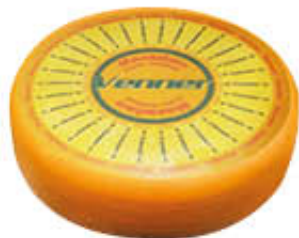
MAASDAMMER FORMA AL KG