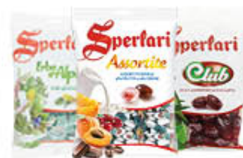
SPERLARI CARAMELLE SACCHETTI TUTTI I GUSTI 175/200 GR