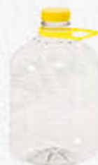
DAMA PET CAPACITÀ 3 LITRI