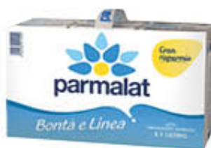
PARMALAT LATTE PARZIALMENTE SCREMATO BRICK - 1 LITRO X 6