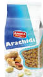
AMICA CHIPS ARACHIDI SALATE 1 KG