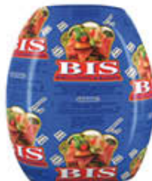
BEHELLI SPALLA COTTA BIS AL KG