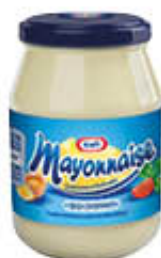
KRAFT MAYONNAISE VASO 175 GR