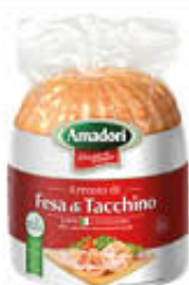
AMADORI GRANROSTY FESA DI TACCHINO AL KG