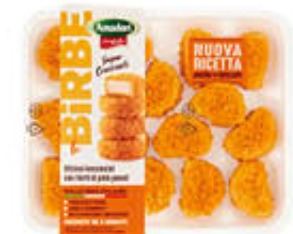
AMADORI BIRBE DI POLLO 300 GR