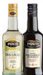
PONTI ACETO DOLCEAGRO/ BALSAMICO DI MODENA 50 CL