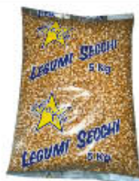
LA STUZZICANTE MAIS PER POPCORN 5 KG