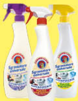
CHANTE CLAIR SGRASSATORE SPRAY 600 ML