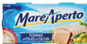
MAREAPERTO TONNO ALL'OLIO DI OLIVA 160 GR X 2