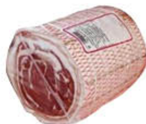
PRAZZOLI PANCETTA ARROTOLATA 1/2 SV AL KG