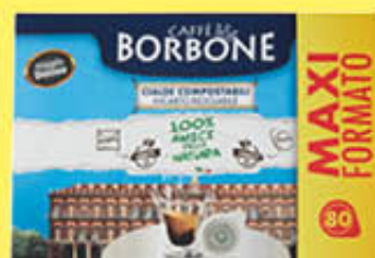
CAFFÈ BORBONE MISCELA DECISA 80 CIALDE