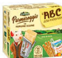
GRANTERRE L'ABC DELLA MERENDA CON PARMIGIANO