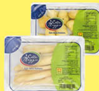
DIANO CASEARIA SCAMORZA AFFUMICATA BASTONCINI/ CILEGINI 200 GR