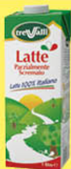
TRE VALLI LATTE PARZIALMENTE SCREMATO 1 LITRO