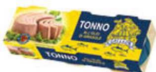
GALLEON TONNO OLIO DI GIRASOLE 70 GR X 3