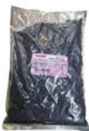
VINCENZINO BARRA GOCCE DI CIOCCOLATO 1 KG