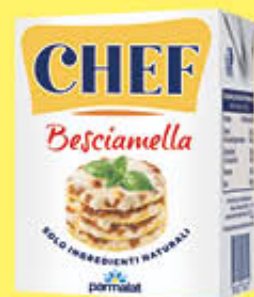
PARMALAT BESCIAMELLA CHEF 200 ML