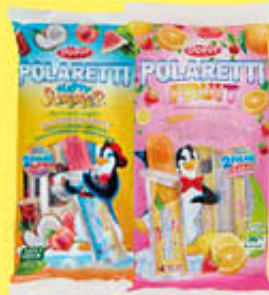
DOLFIN POLARETTI FRUIT/SUMMER 10 PEZZI