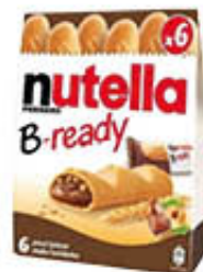
NUTELLA B-READY X 6 132 GR