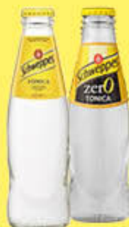
SCHWEPES TONICA CLASSICA/ZERO 18 CL