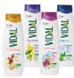
VIDAL SHAMPOO TUTTI I TIPI 250 ML