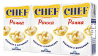
PARMALAT PANNA CHEF 125 ML X 3