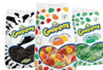
GNAMMY CARAMELLE GOMMOSE GUSTI ASSORTITI 150 GR