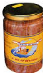
D'AVINO FILETTI ALICI OLIO SEMI 320 GR