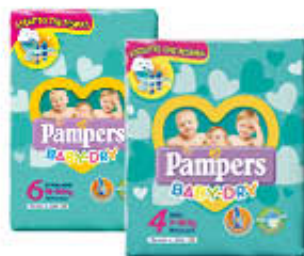
PAMPERS PANNOLINI BABY DRY TUTTE LE MISURE