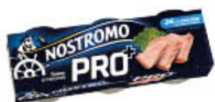
NOSTROMO PRO+ 65GR X 3