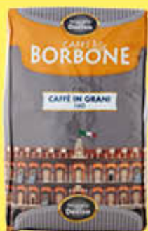
BORBONE MISCELA DECISA CAFFÈ IN GRANI 1 KG