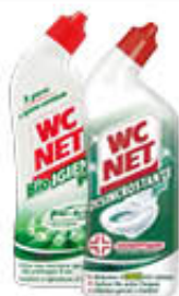
WC NET LIQUIDO TUTTI I TIPI 700 ML