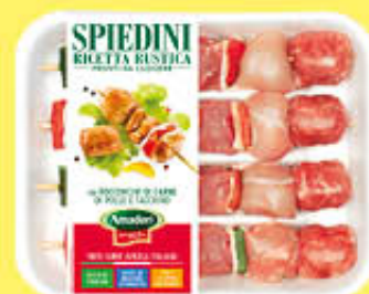
AMADORI SPIEDINO RUSTICO MAXI AL KG