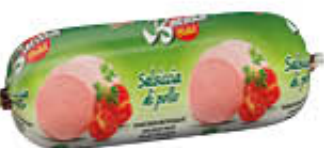
BARAKA SALSICCIA COTTA POLLO HALAL 500 GR