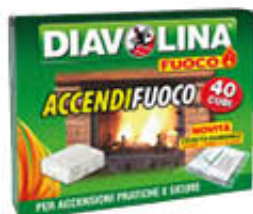
DIAVOLINA ACCENDIFUOCO 40 CUBI