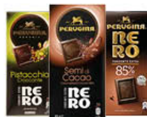
PERUGINA TAVOLETTE NERO 85 GR