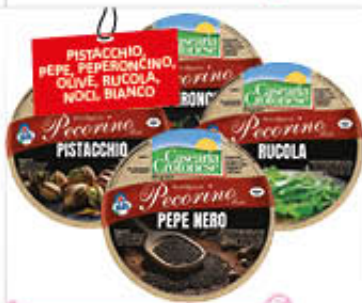
CROTONESE CACIOTTA PECORINO AL KG