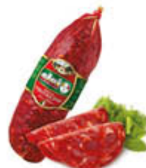
CLAI SALAME VENTICINA 1/2 SV AL KG