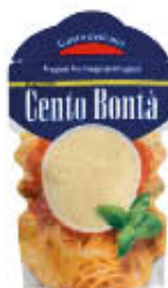
BIRAGHI GRATTUGIATO CENTO BONTÀ 100 GR