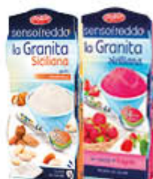
DOLFIN GRANITA SENSOFREDDO 100 ML X 2