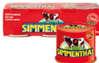
SIMMENTHAL CARNE 3 X 90 GR