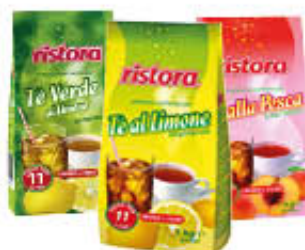
RISTORA THE LIOFILIZZATO PRONTO 1 KG