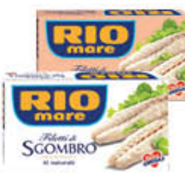
RIO MARE FILETTI DI SGOMBRO AL NATURALE/ IN OLIO DI OLIVA 125 GR