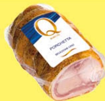
QUALITÀ PIÙ PORCHETTA 1/2 SV AL KG