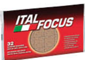
ITALFOCUS ACCENDIFUOCO ECOLOGICO X 32