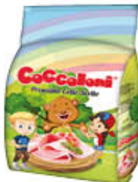
COCCOLONI PROSCIUTTO COTTO SCELTO AL KG