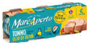
MAREAPERTO TONNO ALL'OLIO DI OLIVA 60 GR X 3