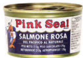
PINK SEAL SALMONE ROSA 213 GR