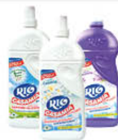
RIO CASAMIA VARI TIPI 1,25 LITRI