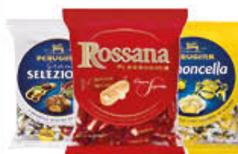
PERUGINA ROSSANA/ GRANSELEZIONE/ LEMONCELLA 175 GR