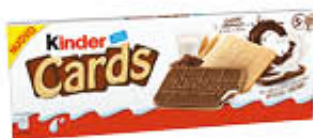
KINDER CARDS X 5 128 GR