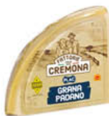
PLAC GRANA PADANO SOTTOVUOTO 1/8 DI FORMA AL KG