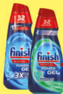
FINISH GEL TUTTO IN 1 LEMON/REGULAR 600 ML