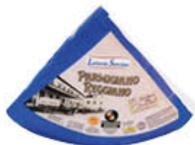
SORESINA PARMIGIANO REGGIANO 1/8 SV +22 M AL KG