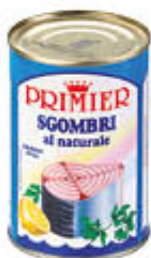
PRIMIER SGOMBRI AL NATURALE 425 GR