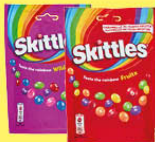
SKITTLES POUCH VARI TIPI 136 GR