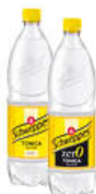
SCHWEPES TONICA CLASSICA/ZERO PET - 1 LITRO