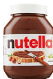
NUTELLA VASETTO 450 GR