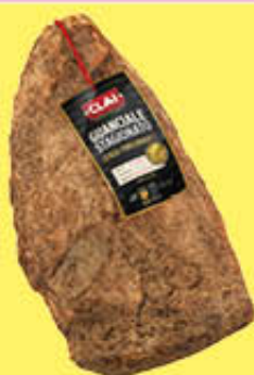
CLAI GUANCIALE STAGIONATO SV AL KG