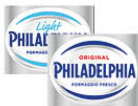
PHILADELPHIA CLASSICA/ LIGHT 80 GR