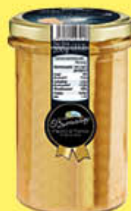
O'SARRACINO FILETTI DI TONNO IN OLIO DI OLIVA 200 GR