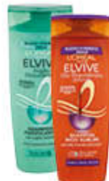
ELVIVE SHAMPOO ML 285