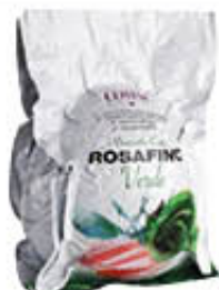
ROSAFINO PROSCIUTTO COTTO VERDE AL KG