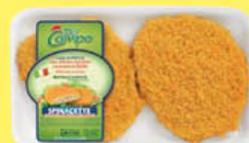
DEL CAMPO SPINACETTE STD 220 GR