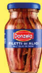
DONZELA FILETTI DI ALICI IN OLIO DI SEMI 80 GR