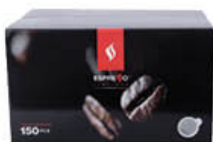
ESPRESSO 150 CIALDE CAFFÈ ARMONIOSO