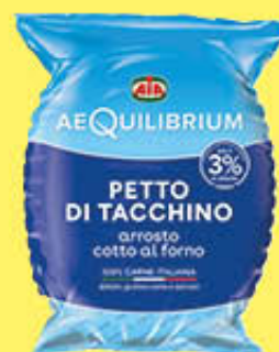
AEQUILIBRIUM PETTO TACCHINO ARROSTO MASCIO AL KG