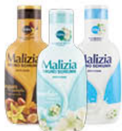
MALIZIA BAGNOSCHIUMA TUTTI I TIPI 1 LITRO