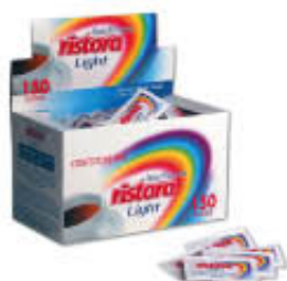
RISTORA DOLCIFICANTE LIGHT 150 BUSTINE