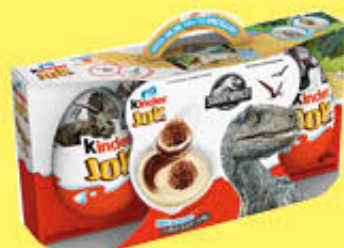
KINDER JOY T.3