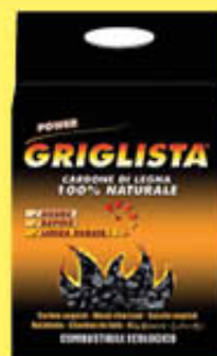
GRIGLISTA CARBONE DI LEGNA 2 KG