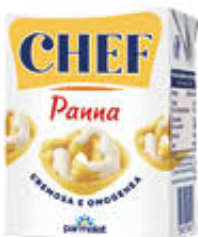
PARMALAT PANNA 200 ML