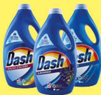
DASH LIQUIDO 45 LAVAGGI