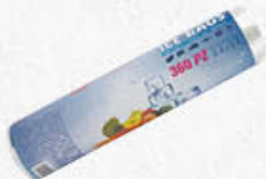
DEALO ICE BAGS 22X32CM 360 PZ