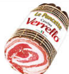
CASCINA VERRELLO PANCETTA COPPATA 1/2 SV AL KG