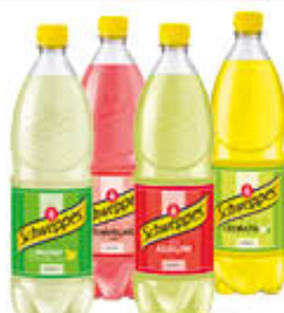
SCHWEPES ALLA FRUTTA PET - 1 LITRO