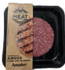
AMADORI HAMBURGER DI BOVINO ADULTO ANGUS 180 GR