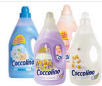
COCCOLINO AMMORBIDENTE TUTTI I TIPI 3 LITRI