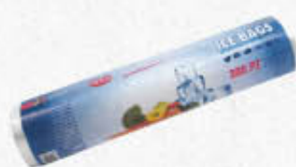
DEALO ICE BAGS 28X40CM 300 PZ