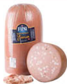
FINI MORTADELLA EMILIA CON E SENZA PISTACCHI AL KG