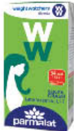
PARMALAT LATTE PUNTO SCREMATO UHT 500 ML