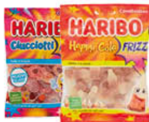
HARIBO CARAMELLE FRIZZANTI 150/175 GR