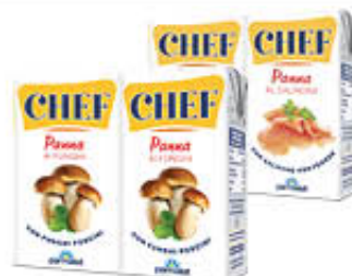
PARMALAT PANNA AGLI AROMI TUTTI I TIPI 125 ML X 2