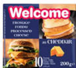
WELCOME FORMAGGIO FETTINE CHEDDAR 200 GR