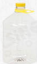
DAMA IN PET CAPACITÀ 5 LITRI