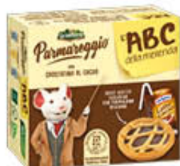
GRANTERRE L'ABC MERENDA CROSTATINA AL CIOCCOLATO