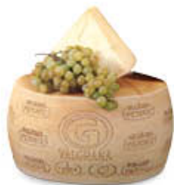
VALGRANA DEL PIEMONTE FORME AL KG