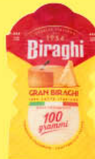
GRANBIRAGHI GRATTUGIATO 100 GR