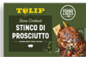
TULIP STINCO DI SUINO COTTO 600 GR