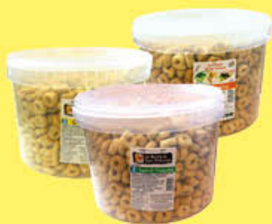
SAN TRIFONE TARALLI VARI GUSTI SECCHIELLO 3 KG