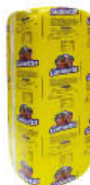
BEHELLI SPALLA COTTA TOAST GUSTO SETTA AL KG