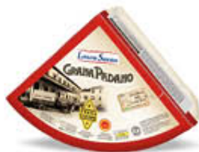
SORESINA GRANA PADANO 1/8 SV AL KG