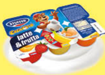
STUFFER LINEA BIANCA LATTE & FRUTTA 50 GR X 6