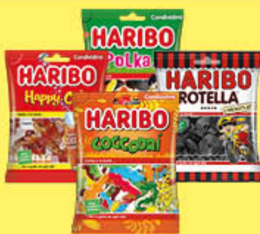
HARIBO CARAMELLE TUTTI I TIPI 140/175 GR