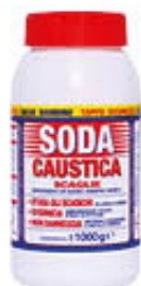
SODA CAUSTICA SCAGLIE BARATTOLO 1 KG