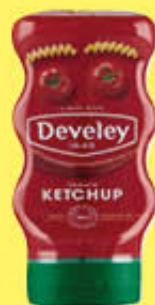
DEVELEY KETCHUP 273 GR