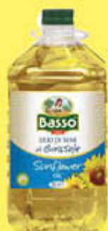
BASSO OLIO DI SEMI DI GIRASOLE PET - 5 LITRI