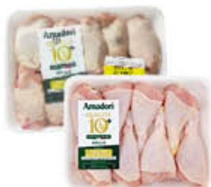
AMADORI FUSI DI POLLO/ SOVRACOSCE MAXI AF10+ AL KILO