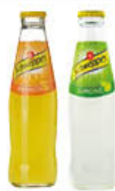
SCHWEPES ARANCIA/ LIMONE 18 CL