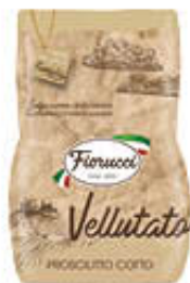
FIORUCCI PROSCIUTTO COTTO VELLUTATO BAULETTO AL KG