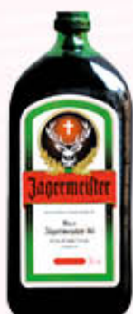
JAGERMEISTER 1 Litro