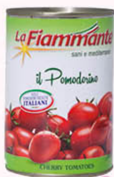
LA FIAMMANTE POMODORINI DI COLLINA 400 gr