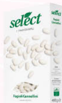
SELECT FAGIOLI CANNELLINI SECCHI 400 gr