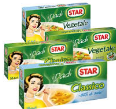
STAR DADO CLASSICO/VEGETALE/ -30% di Sale 10 Cubi