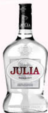
JULIA GRAPPA MORBIDA 70 cl