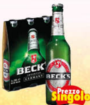
BECK'S BIRRA 33 cl