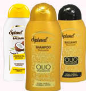
SPLEND'OR SHAMPOO E BALSAMO OLIO 300 ml