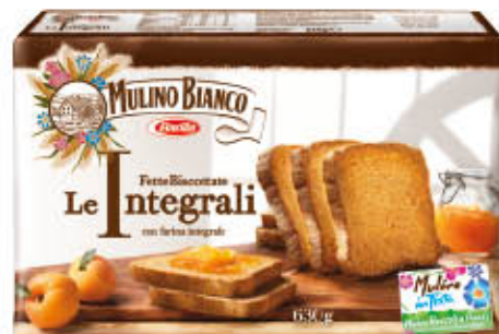
MULINO BIANCO FETTE LE INTEGRALI 630 gr