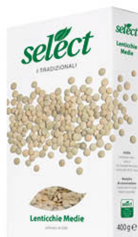
SELECT LENTICCHIE MEDIE 400 gr