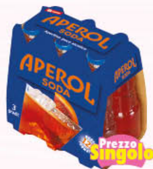
APEROL SODA 12,5 cl