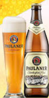
PAULANER BIRRA OKTOBERFEST 50 cl