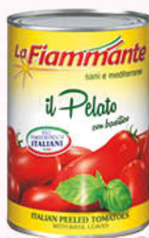
LA FIAMMANTE PELATI C/BASILICO 400 gr