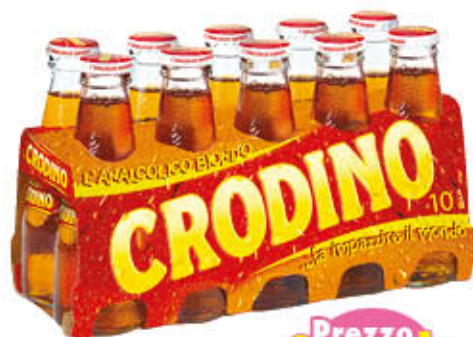
CRODINO APERITIVO 10 cl