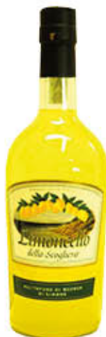
DILMOOR LIMONCELLO DELLA SCOGLIERA 30 cl 70 CL