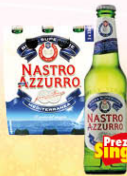
NASTRO AZZURRO BIRRA Vetro 33 cl