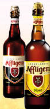
AFFLIGEM BIRRA Blonde/Brune 75 cl