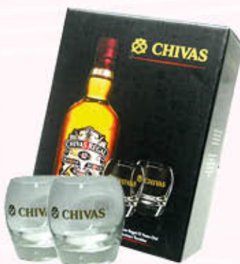
CHIVAS WHISKY Conf + 2 Bicchieri 70 cl