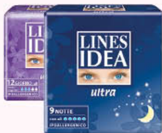
LINES IDEA ULTRA Vari Tipi