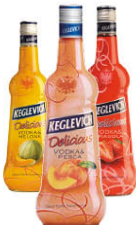
STOCK KEGLEVICH VODKA ALLA FRUTTA Escluso Limone 70 cl