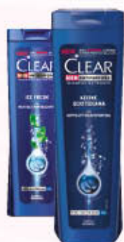
CLEAR SHAMPOO 250 ml