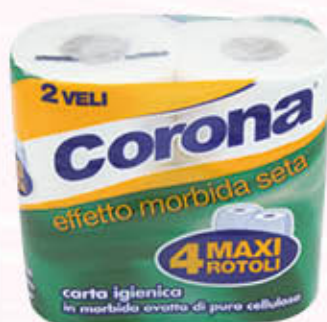
CORONA CARTA IGIENICA 4 Maxi Rotoli 2 Veli