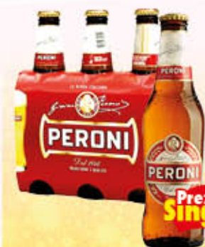
PERONI BIRRA Vetro 33 cl