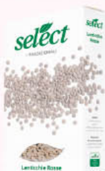
SELECT LENTICCHIE ROSSE 400 gr