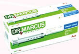
DR. MARCUS SIRINGHE STERILI 5 ml x 10