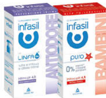
INFASIL INTIMO 200 ml