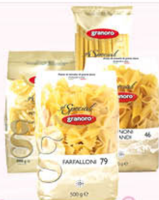
GRANORO PASTA FORMATI SPECIALI 500 gr