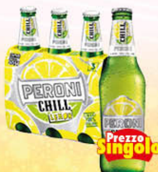
PERONI CHILL LEMON 33 cl