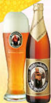
FRANZISKANER BIRRA WEISSBIER 50 cl