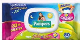
PAMPERS SALVIETTE SOLE E LUNA x 60 + 20