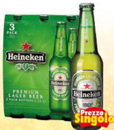
HEINEKEN BIRRA Vetro 33 cl