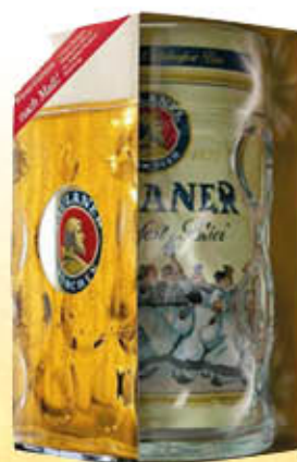
PAULANER BIRRA OKTOBERFEST Lattina 1 Litro + BOCCALE