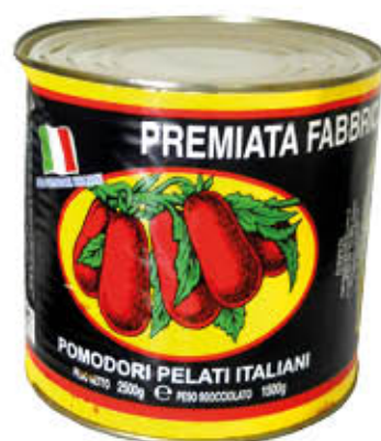
LA PAESANA- PAUDICE POMODORI PELATI 2500 gr