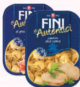
FINI PASTA FRESCA RIPIENA VARI GUSTI 250 gr