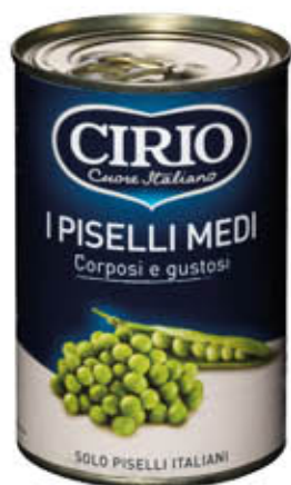
CIRIO PISELLI MEDI 410 gr