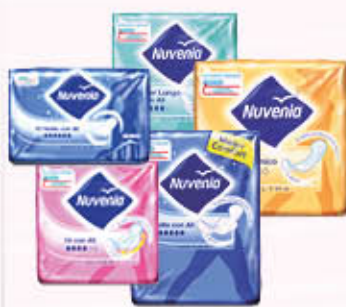
NUVENIA ASSORBENTI ULTRA/NOTTE