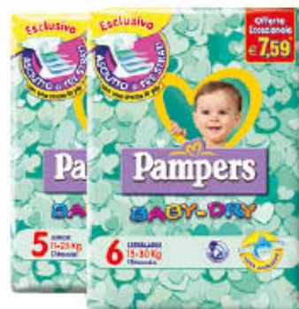
PAMPERS PANNOLINI BABY DRY Varie Misure