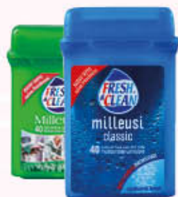
FRESH & CLEAN 40 SALVIETTE