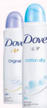
DOVE DEODORANTE SPRAY 150 ml