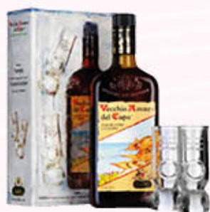
VECCHIO AMARO DEL CAPO Confezione 70 cl + 2 Bicchieri