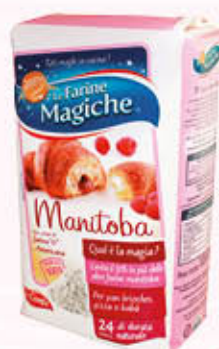
LO CONTE FARINA AMERICANA 1 Kg