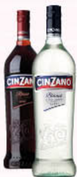
CINZANO 1 Litro