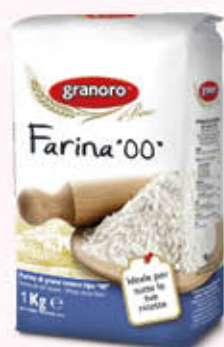
GRANORO FARINA TIPO 00 1 Kg