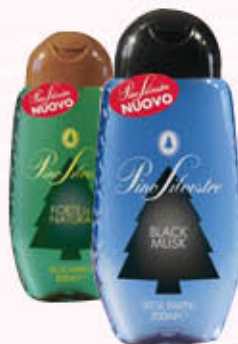
PINO SILVESTRE DOCCIA SHAMPOO 250 ml