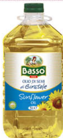
BASSO OLIO DI SEMI DI GIRASOLE Pet - 5 Litri