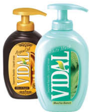
VIDAL SAPONE LIQUIDO 300 ml