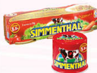
SIMMENTHAL CARNE IN GELATINA 70 gr