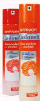
CADONETT LACCA 250 ml