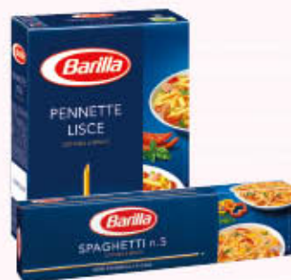
BARILLA PASTA DI SEMOLA FORMATI TRADIZIONALI 500 gr