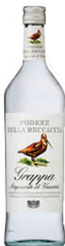
PODERE DELLA BECCACCIA GRAPPA 1 LITRO