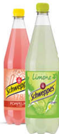
SCHWEPES ALLA FRUTTA 1 Litro