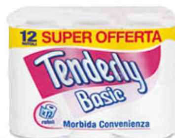
TENDERLY CARTA IGIENICA BASIC 12 ROTOLI