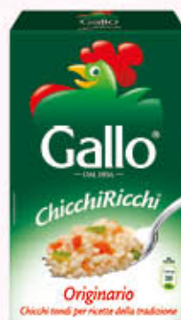
GALLO RISO ORIGINARIO 1 Kg