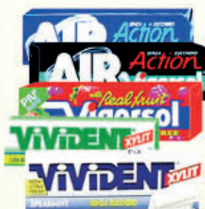
VIVIDENT XYLIT AIR ACTION/ VIGORSOL STICK Senza Zucchero