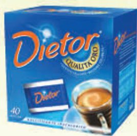
DIATOR DOLCIFICANTE 40 BUSTE