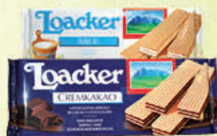
LOACKER Vari Gusti 175 gr