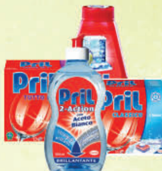
PRIL LINEA LAVASTOVIGLIE