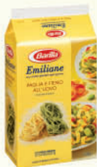
BARILLA EMILIANE PAGLIA E FIENO 250 gr