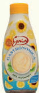
GAIA MAIONESE GOURMET TWISTER 820 ml