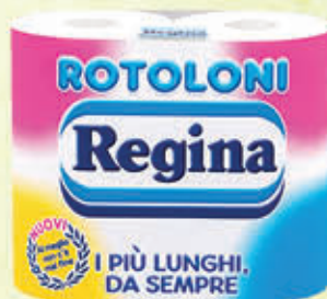
REGINA ROTOLONI CARTA IGIENICA 4 Rotoli