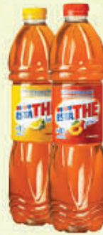
FERRERO ESTATHE Pesca/Limone 1,5 Litri