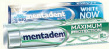
MENTADENT DENTIFRICIO MAXIMUM PROTECTION/ WHITE NOW 75 cl