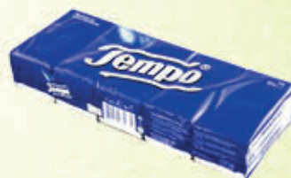
TEMPO FAZZOLETTI 10 Pacchetti