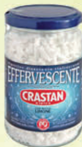
CRASTAN EFFERVESCENTE VASO VETRO 250 gr