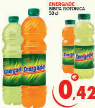
ENERGADE BIBITA ISOTONICA 50 cl