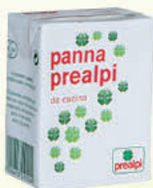
PREALPI PANNA 200 ml