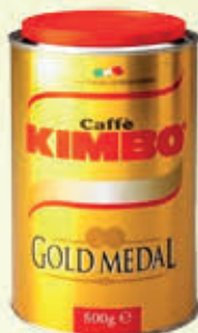
KIMBO CAFFE GOLD MEDAL Latta - 500 gr