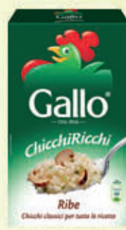
GALLO RISO RIFE 1 Kg