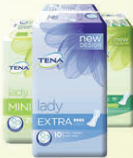
TENA LADY ASSORBENTI Vari Tipi