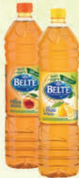
VERA BELTE PESCA/LIMONE 1,5 Litri