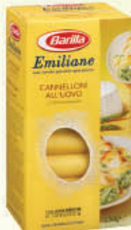
BARILLA CANNELLONI 250 gr