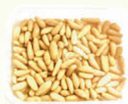
AROMI BARRA PINOLI VASCHETTA - 35 gr