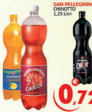
SAN PELLEGRINO CHINOTTO 1,25 Litri