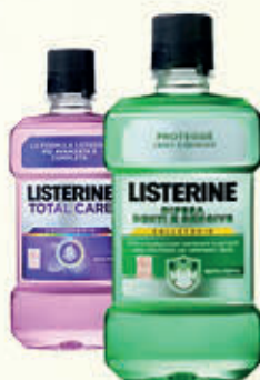
LISTERINE COLLUTORIO 500 ml