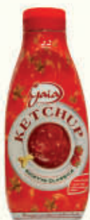
GAIA KETCHUP NATURE TWISTER 950 gr