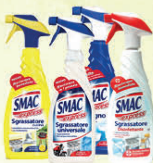
SMAC EXPRESS SPRAY 650 ml