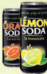
LEMONSODA/ ORANSODA Lattina 33 cl