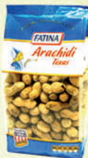
FATINA ARACHIDI TOSTATI CON GUSCIO 300 gr