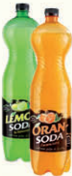
ORANSODA/ LEMONSODA 1,5 Litri