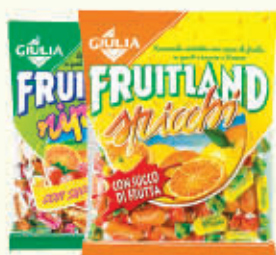
GIULIA CAREMELLE Vari Gusti 200 gr