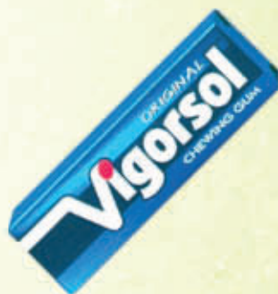
VIGORSOL CON ZUCCHERO