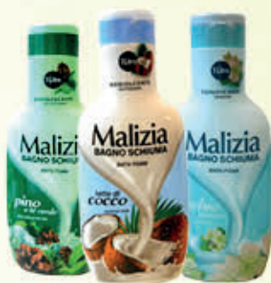
MALIZIA BAGNOSCHIUMA Varie Profumazioni 1 Litro