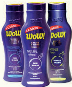
WOW BAGNOSCHIUMA Varie Profumazioni 750 ml