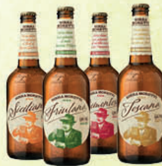
MORETTI BIRRA LE REGIONALI 50 cl