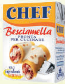
PARMALAT BESCIAMELLA CHEF 200 ml