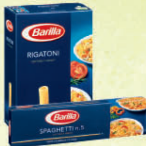
BARILLA PASTA DI SEMOLA Varie Trafile 500 gr