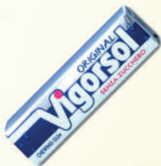
VIGORSOL SENZA ZUCCHERO