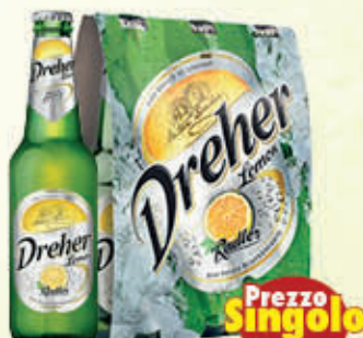
DREHER RADLER LEMON 33 cl