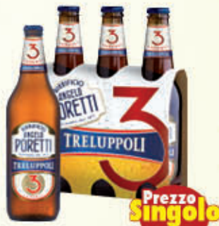
PORETTI BIRRA 3 LUPPOLI 33 cl