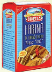
DIVELLA FARINA TIPO "00" 1 Kg