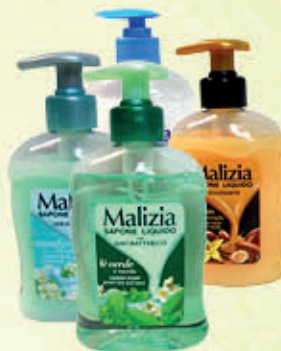
MALIZIA SAPONE LIQUIDO Dispenser - 300 ml