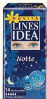
LINES ASSORBENTI IDEA NOTTE x 14