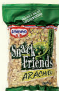
CAMEO ARACHIDI 300 gr