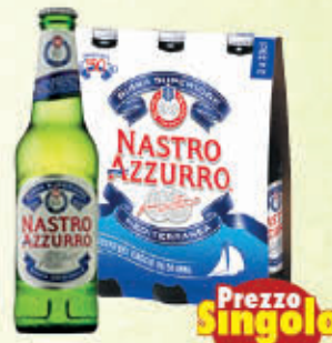
NASTRO AZZURRO BIRRA 33 cl