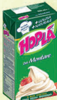
HOPLA PANNA DA MONTARE ZUCCHERATA 500 gr