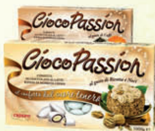
CRISPO CIOCCO PASSION 1 Kg