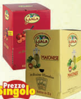
GAIA MAIONESE/KETCHUP Bustine